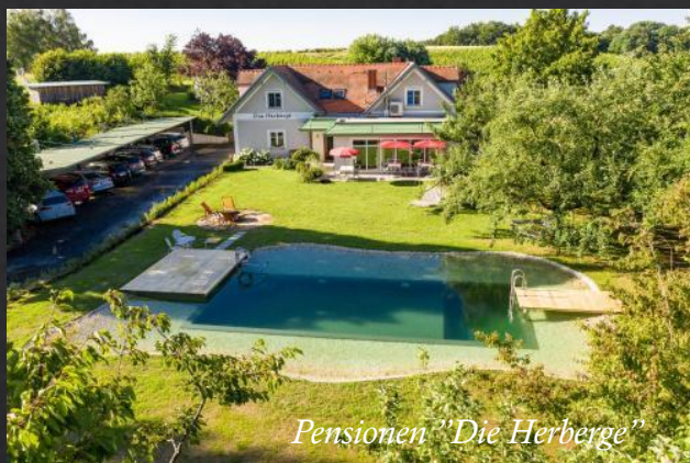
Pensionen "Die Herberge"