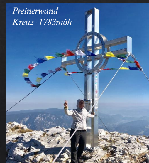
Preinerwand Kreuz -1783möh

Sö 9/6 FLYG OS317 20:25-22:35 Vienna International – Stockholm Arlanda